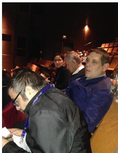
Prise de notes