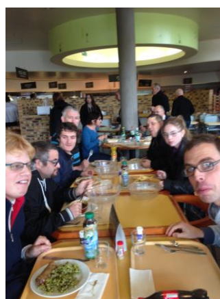
Sur la route du Retour !