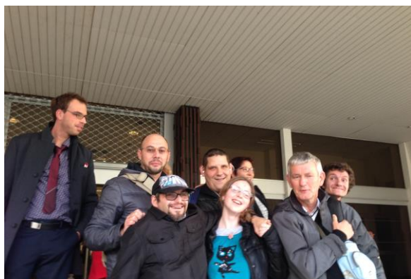
Fin du congrès