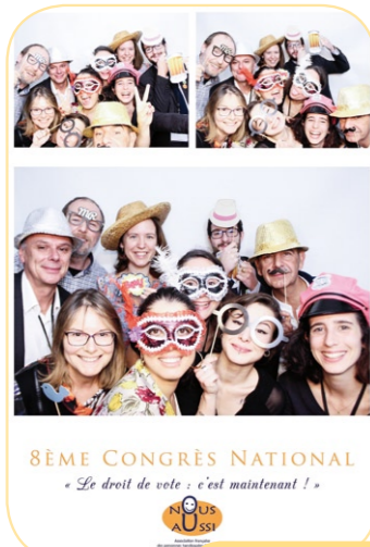
8ÈME CONGRÈS NATIONAL « Le droit de vote, c'est maintenant ! »

Visiblement, les équipes de l'UNAPEI ont beaucoup apprécié leur séjour en Meuse !!!